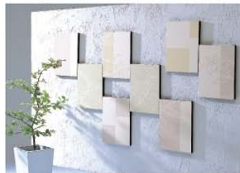
No.131・132・133 を組み合わせた施工例