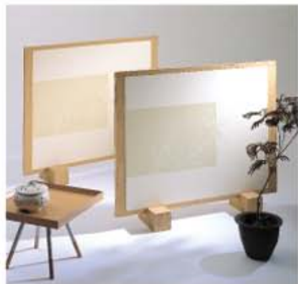
No.142 (手前)・143 (奥)の施工例

花言葉は「信念・テラートな美」。 勅方3時頃に咲いた花は、夕方にはもう萎んでしまい、「種花一朝の夢」 (人の世ははかない)と言われます。