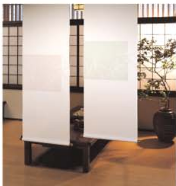
No.141 (左) No.142 (右) の施工例