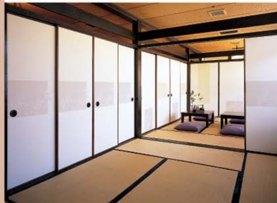
No.141 (左4枚と右手前) No.143 (左から6枚目と8枚目) No.153 (奥左) No.161 (左から5枚目と7枚目、奥右) を組み合わせた施工例