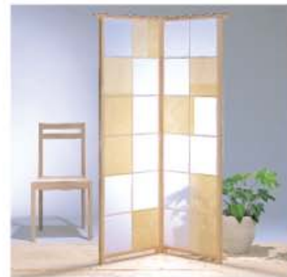
No.163・113・133を組み合わせた施工例

中国では、不老長寿の薬効があるとされる野菊。その花言葉は「真実」。日本人に馴染みの深い可憐なイメージです。