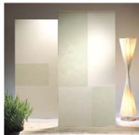
No.132 (子供)・142 (奥) の施工例

「小さな恋人・上品」という花言葉のあるざくらんぼは、キリスト教では天啓の果実にたとえられず、愛らしさが際立ちます。