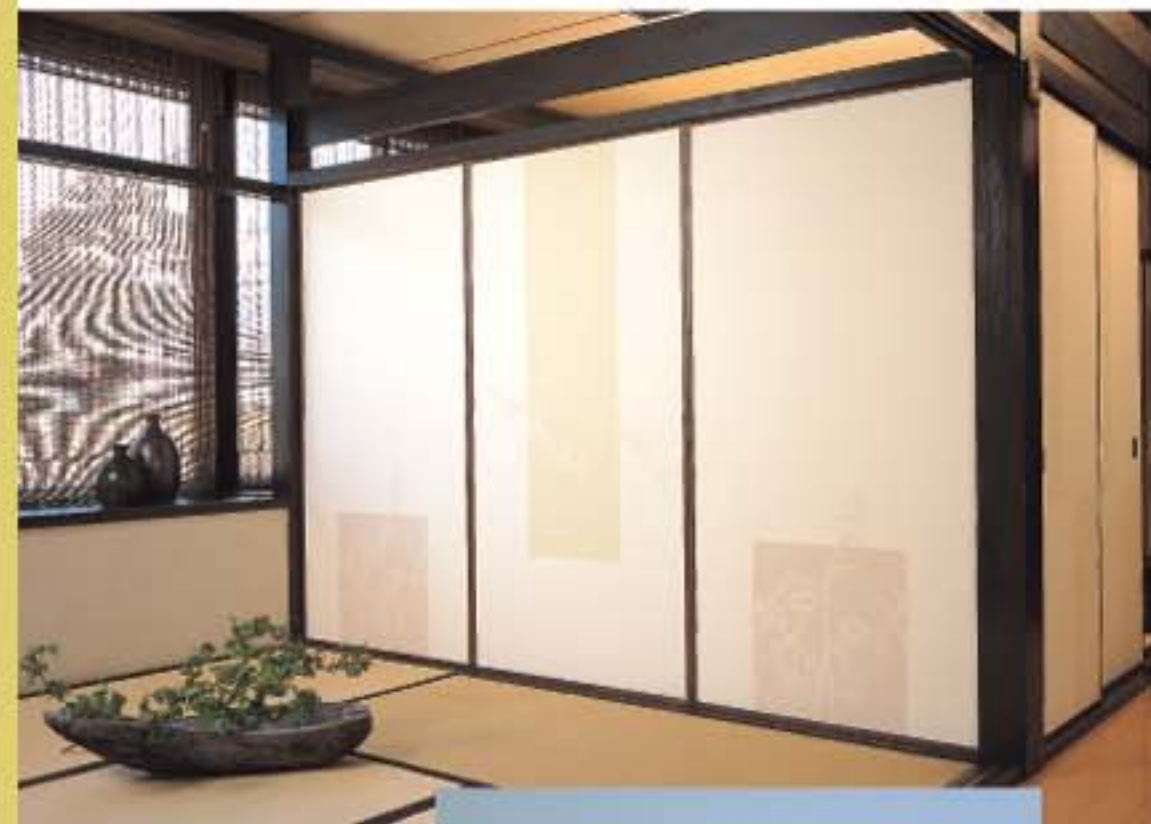
No.161 (左から1枚目と3枚目) No.153 (左から5枚目)の施工例