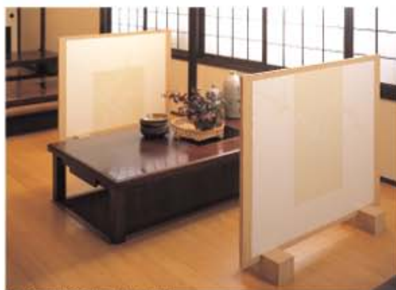
No.153 (手前)・163 (奥)の施工例