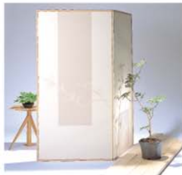
No.151 (左)・161 (右)の施工例

「希望・集中力」が花言葉のれんぎょうは、英名がゴールデン・ベル(金の鐘)。その名の通り、釣り鐘状の黄色い可憐な花をつけます。