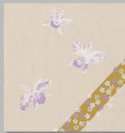
708 P ▶5-20-21