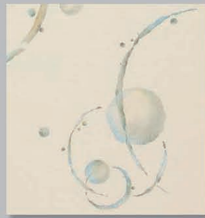
709 P ▶22-23