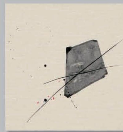
704 P ▶12-13