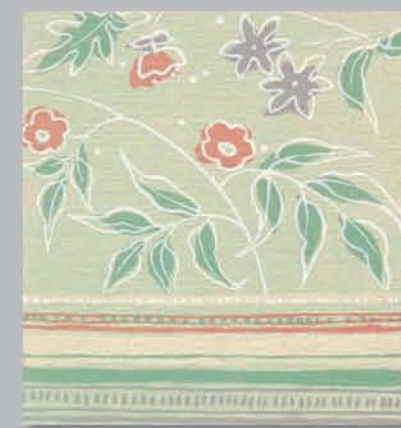
701 P ▶6-7