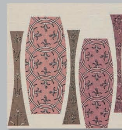
702 P ▶8-9