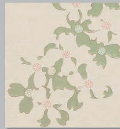
705 P ▶14-15