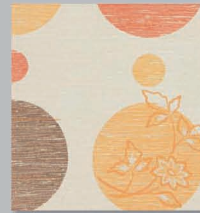
703 P ▶10-11