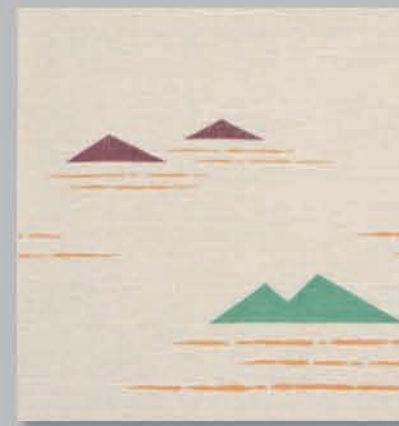
706 P ▶16-17