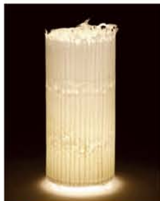
紙遊 ● No.1103 直径200×H420mm [三球40W] 20,900円(税込21,945円) 送料は別途