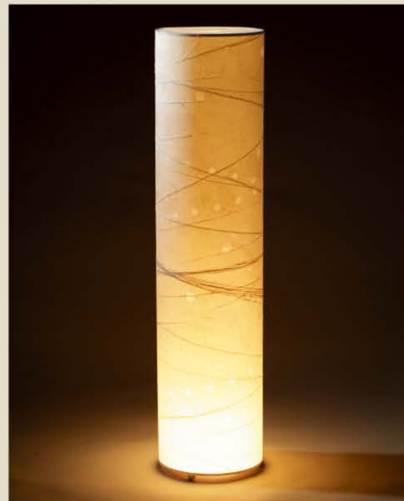
灯紙美 ● No.1505

L: 直径215×H885mm [ミニ球60W] 42,000円(税込44,100円) M: 直径150×H580mm [ミニ球25W] 17,000円(税込17,850円)