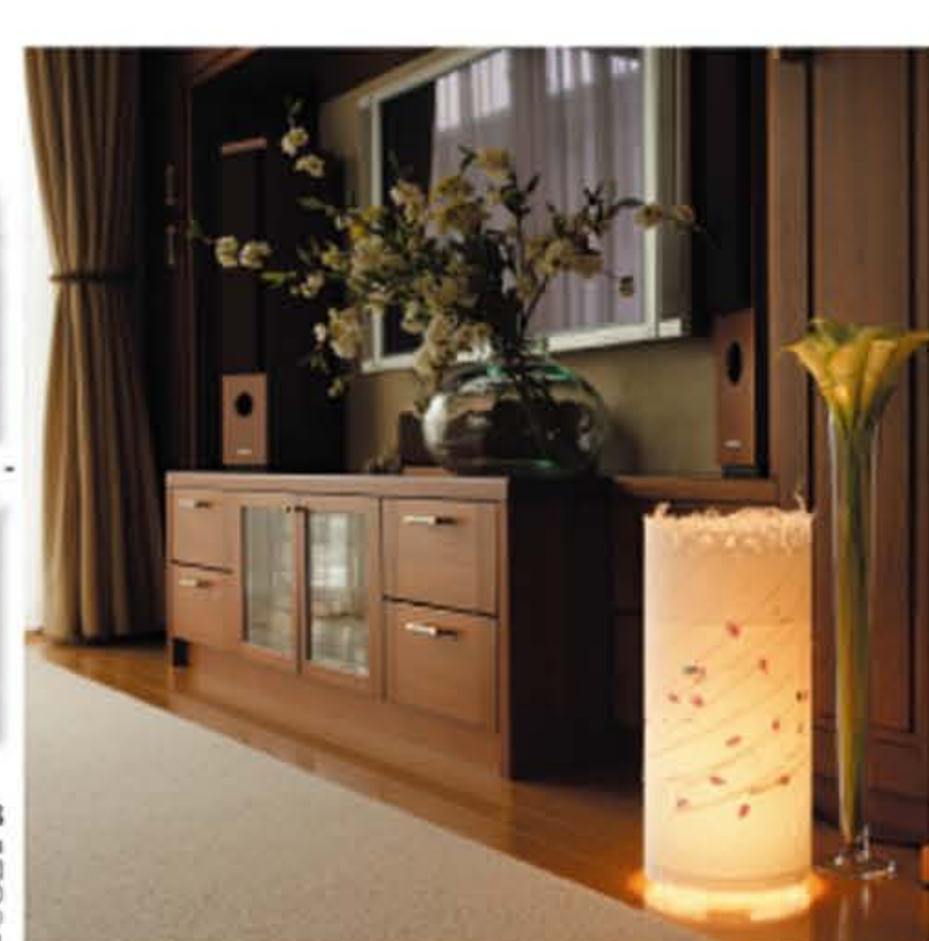
写真はNo.1003-春の手漉き和紙をセットしたものです。