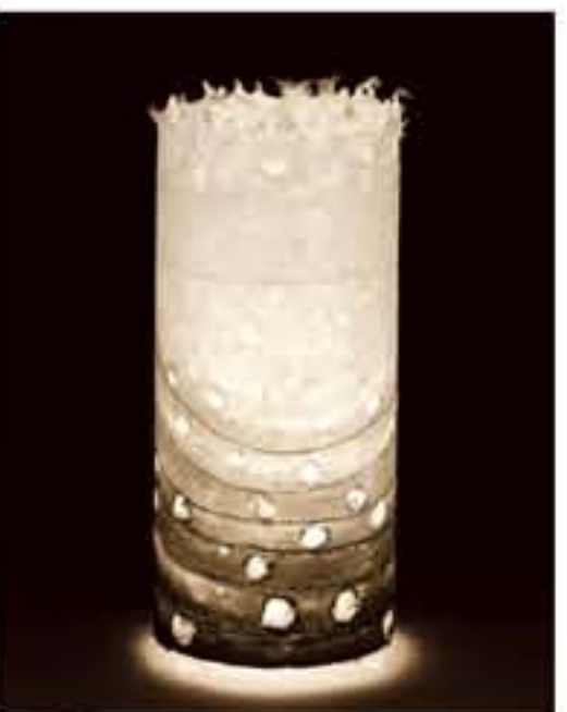
紙遊 ● No.1212 直径200×H420mm [三球40W] 19,800円(税込20,790円) 送料は別途