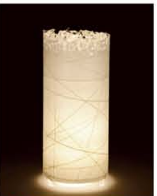
紙遊 ● No.1204 直径200×H420mm [三球40W] 19,800円(税込20,790円) 送料は別途