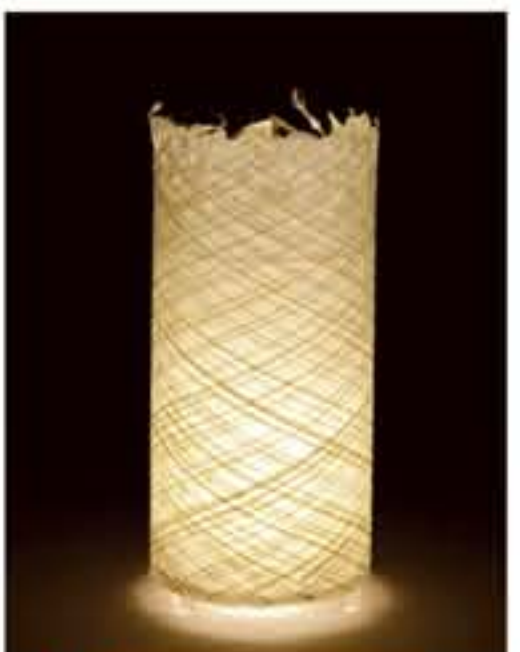
紙遊 ● No.1202 直径200×H420mm [三球40W] 19,800円(税込20,790円) 送料は別途