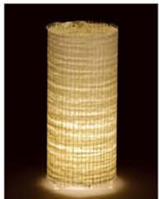
紙遊 ● No.1201 直径200×H420mm [三球40W] 19,800円(税込20,790円) 送料は別途