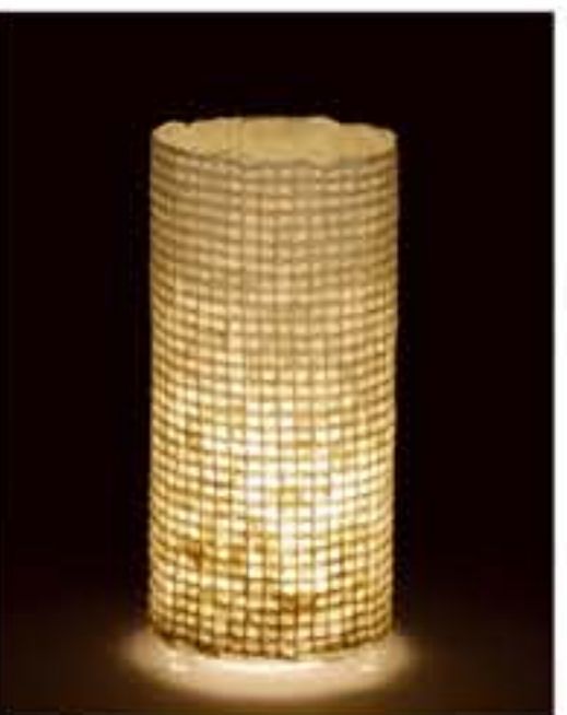
紙遊 ● No.1211 直径200×H420mm [三球40W] 19,800円(税込20,790円) 送料は別途