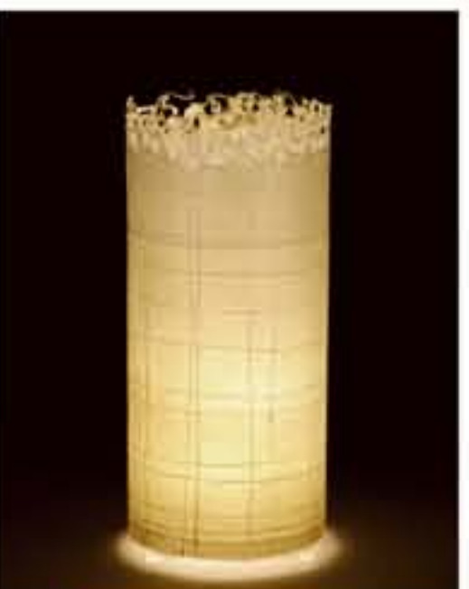
紙遊 ● No.1203 直径200×H420mm [三球40W] 19,800円(税込20,790円) 送料は別途