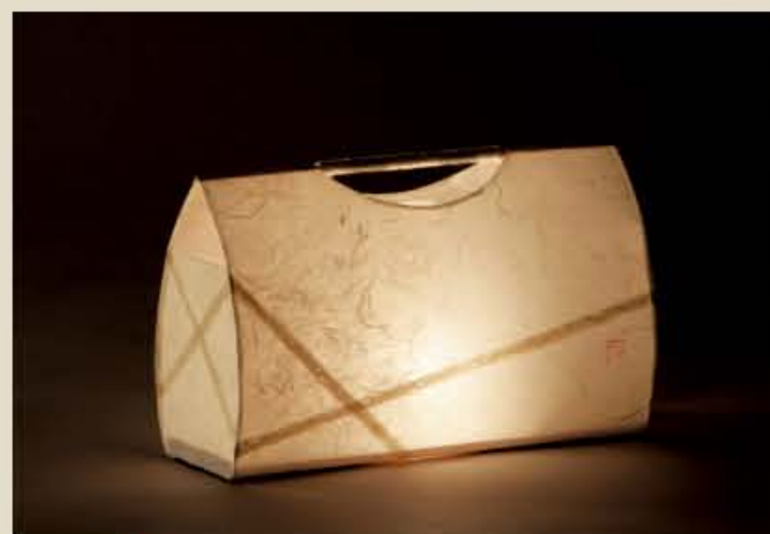
灯紙美 ● No.1503

W305×D115×H190mm [ミニ球25W] 18,000円(税込18,900円)