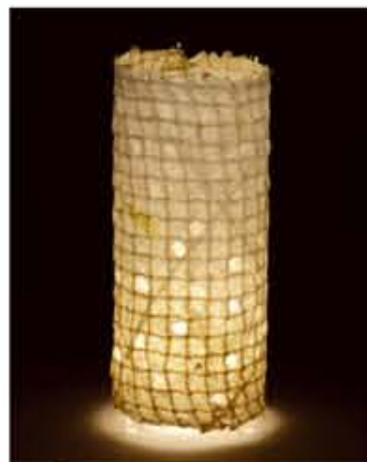
紙遊 ● No.1208 直径200×H420mm [三球40W] 19,800円(税込20,790円) 送料は別途