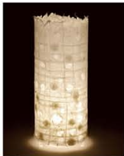
紙遊 ● No.1207 直径200×H420mm [三球40W] 19,800円(税込20,790円) 送料は別途