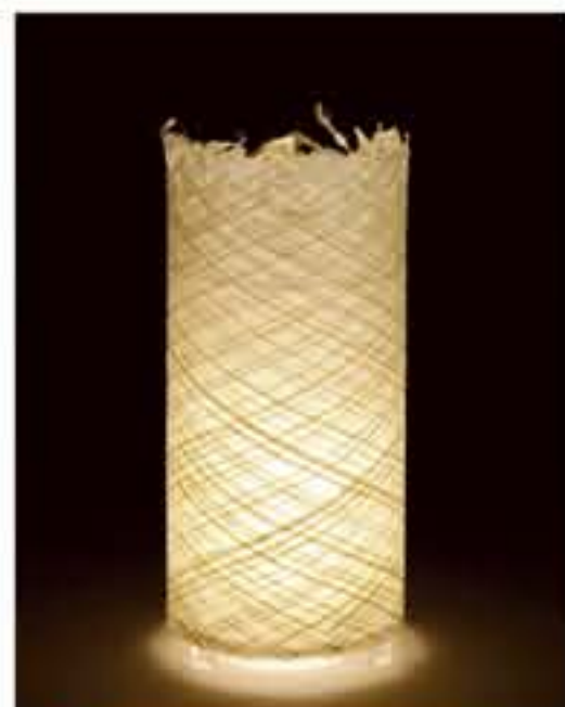
紙遊 ● No.1102 直径200×H420mm [三球40W] 20,900円(税込21,945円) 送料は別途