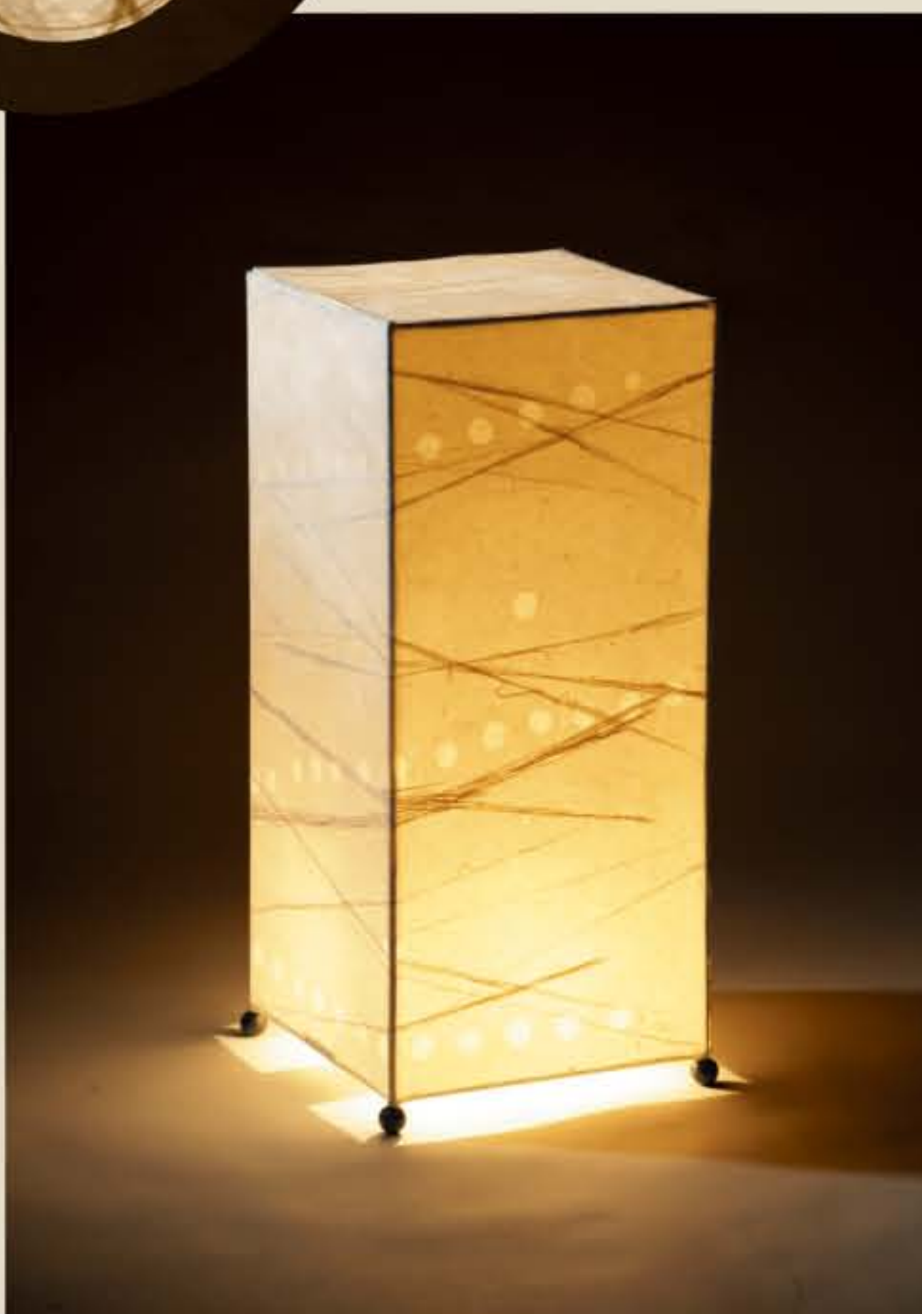
灯紙美 ● No.1504

M: W250×D250×H590mm [ミニ球40W] 39,000円(税込40,950円) S: W250×D250×H280mm [ミニ球25W] 21,500円(税込22,575円)