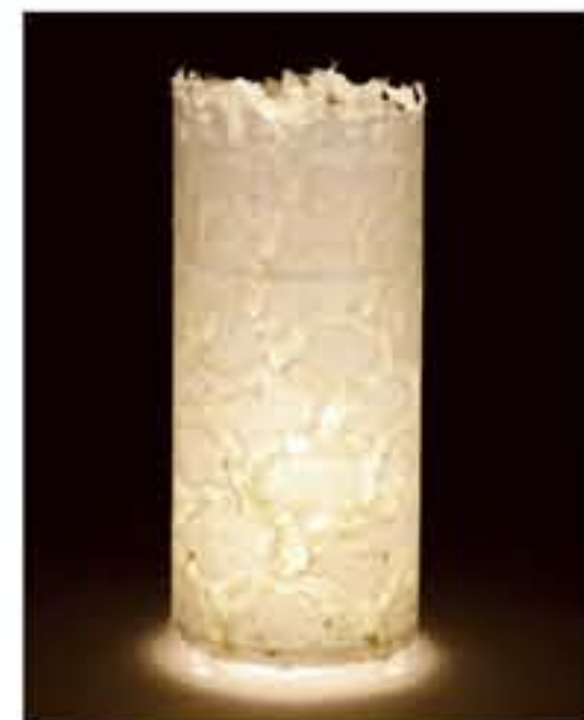
紙遊 ● No.1206 直径200×H420mm [三球40W] 19,800円(税込20,790円) 送料は別途