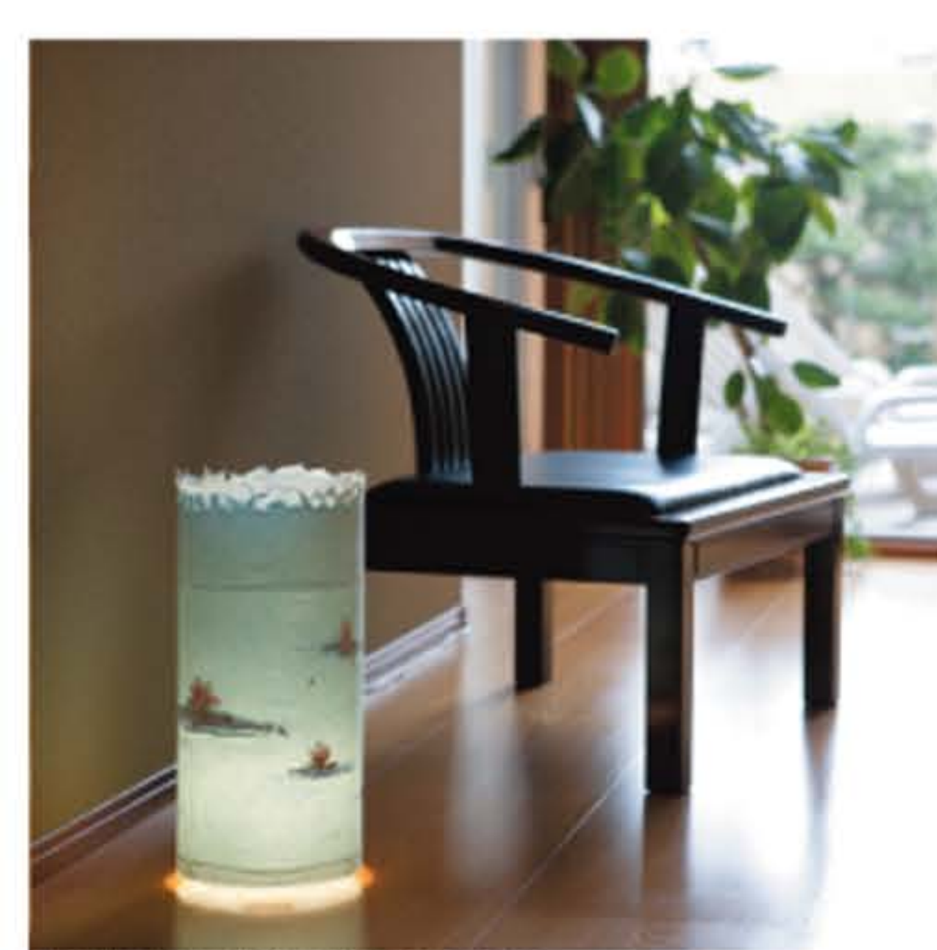
写真はNo.1001-春の手漉き和紙をセットしたものです。