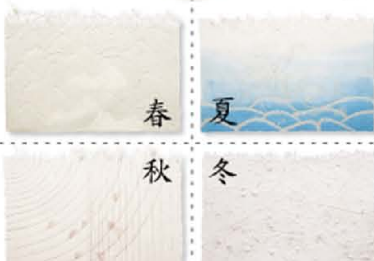
写真はNo.1004-秋の手漉き和紙をセットしたものです。

紙季 ● No.1004 直径200×H420mm 【三二球 40W】 (手漉き和紙4枚付) 29,800円(税込)31,290円 送料は別途