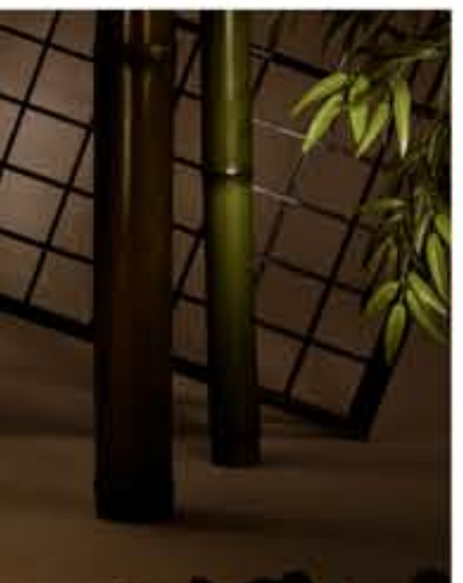
紙遊 ● No.1210 直径200×H420mm [三球40W] 19,800円(税込20,790円) 送料は別途