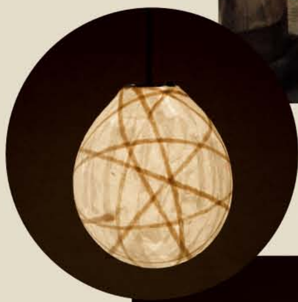
灯紙美 ● No.1502

L: 直径390×H460mm [ミニ球60W] 25,500円(税込26,775円) S: 直径270×H310mm [ミニ球40W] 18,000円(税込18,900円)