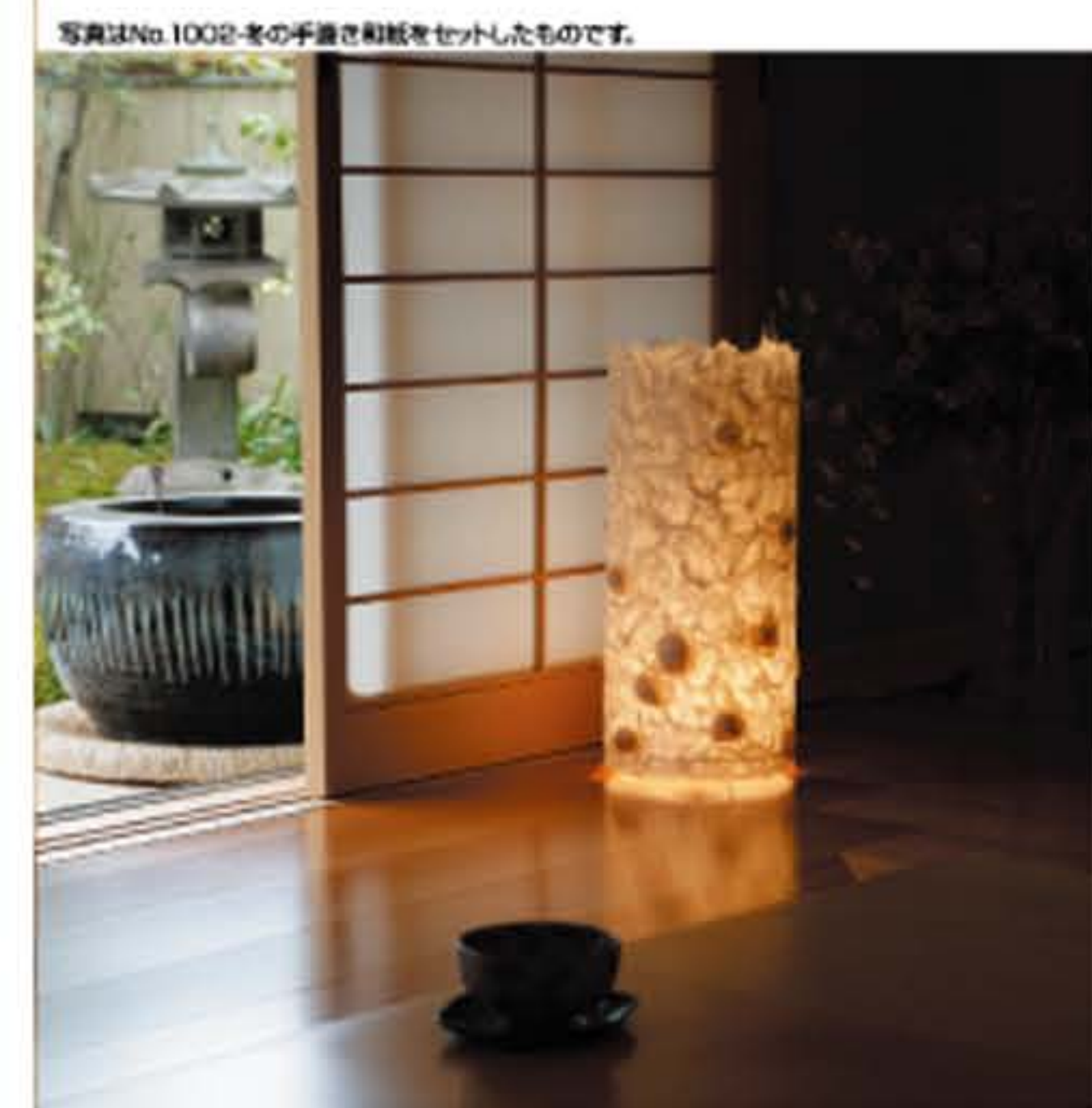
写真はNo.1002-春の手漉き和紙をセットしたものです。

紙季 ● No.1002 直径200×H420mm 【三二球 40W】 (手漉き和紙4枚付) 29,800円(税込)31,290円 送料は別途