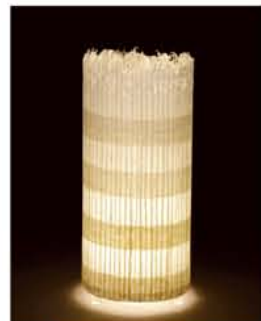
紙遊 ● No.1101 直径200×H420mm [三球40W] 21,900円(税込22,995円) 送料は別途

和紙の裏側と裏側 からマグネットを 合わせて、上部・中 部・下部の3カ所 固定してください。