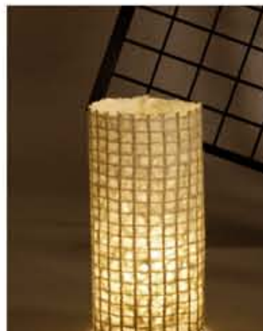
紙遊 ● No.1209 直径200×H420mm [三球40W] 19,800円(税込20,790円) 送料は別途