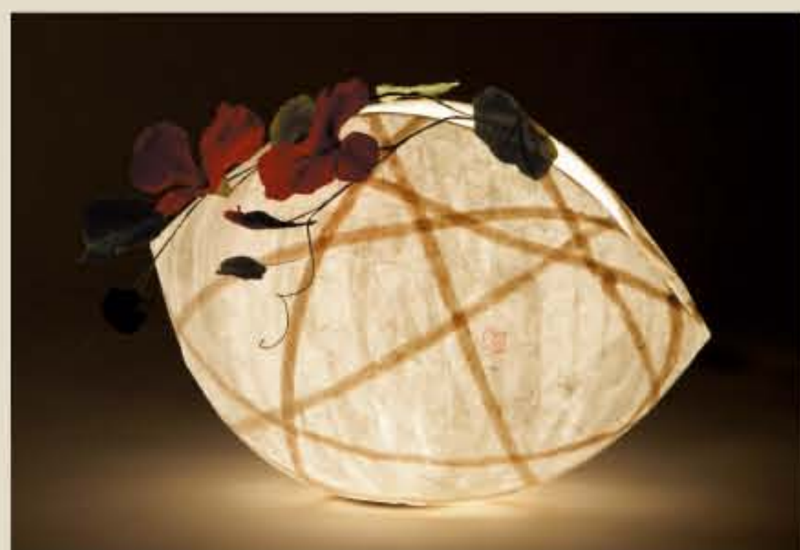
灯紙美 ● No.1501

L: W550×D350×H350mm [ミニ球40W] 27,000円(税込28,350円) S: W420×D250×H250mm [ミニ球25W] 20,000円(税込21,000円)