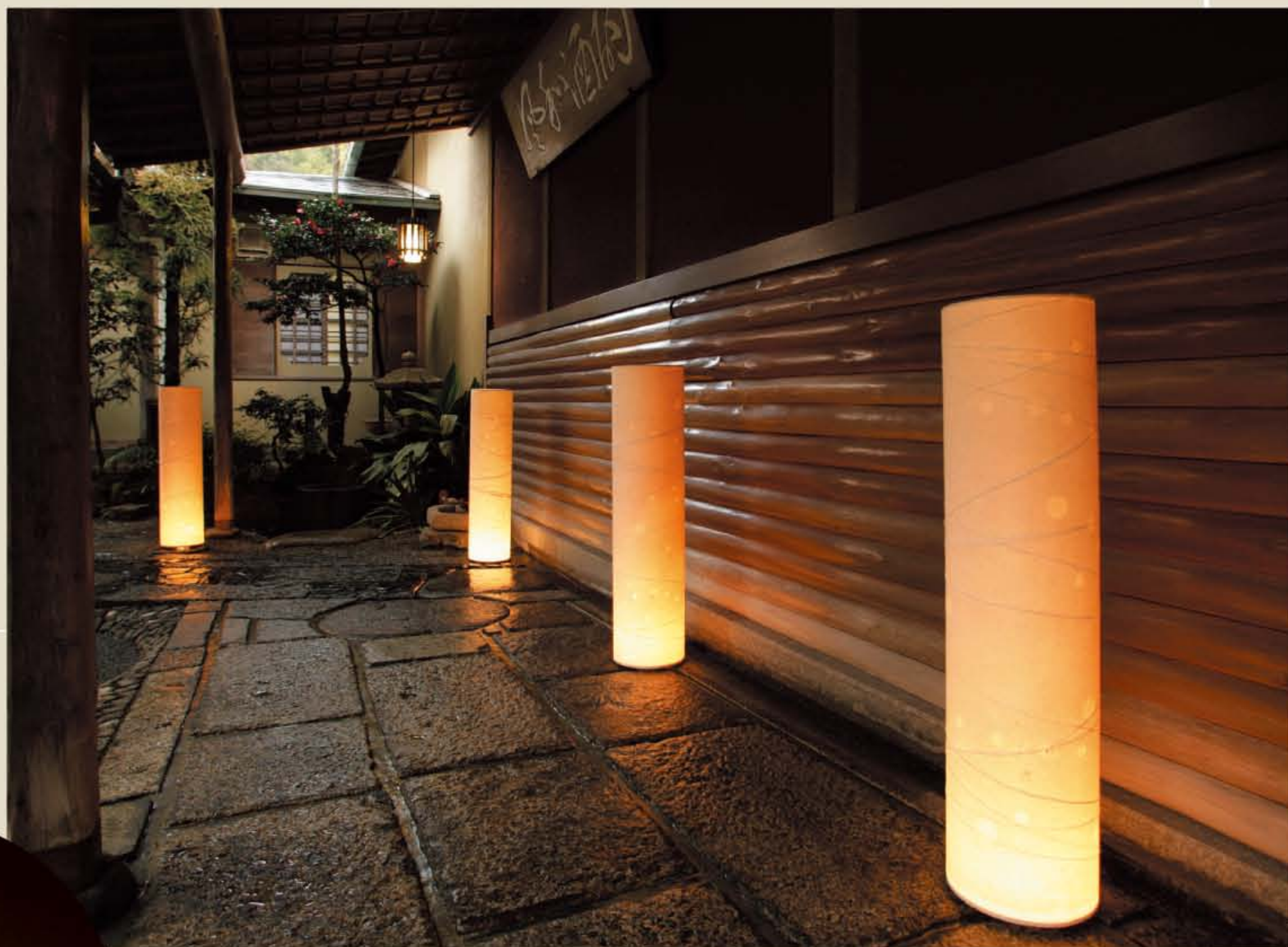
写真はNo.1505・Lの施工例です。

手漉き和紙と竹ひごなど、素材の味や質を最大限に取り込んだシェード。 そのユニークでやわらかいフォルムは、手づくりならではの 遊び心がどこか見え隠れし、どこかほっとするあたたかい あかりで包み込んでくれます。